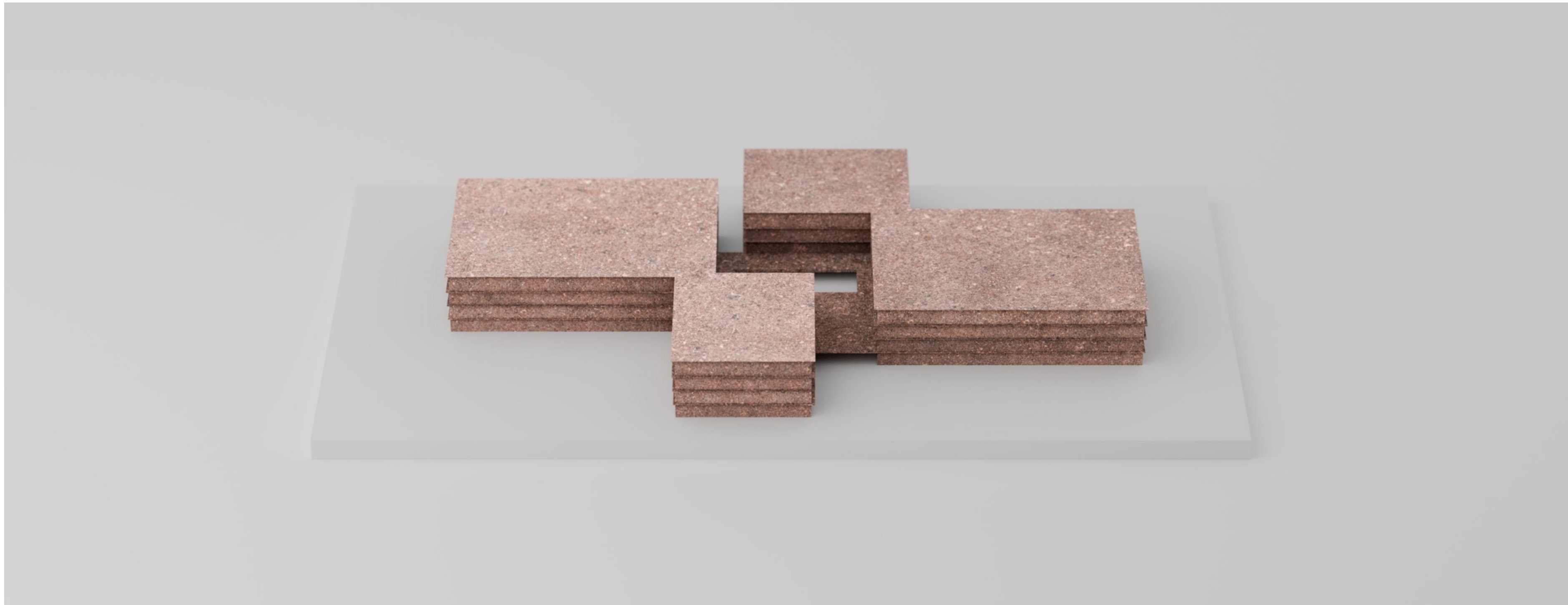
↑ Konceptió- és anyagmodell

Fontos és kiemelt szempontnak tartjuk az intézmény szellemiségével összhangban a fenntartható anyagok használatát, nem csak a belső terekben, de a homlokzatokon is. Az alapvetően vasbeton pillérvázaz szerkezet külső héja, homlokzatburkolata egy egyedi földbeton panel , mely a pincésztint által kiemelt agyagos földet használja fel. Az tervezési területől délre, a Vezér utca és a 35-os főút között volt egykori régla- és cserépgyár a terület agyagos talajának hasznosíthatóságáról tesz tanúbizonyságot. A külső homlokzati héjra szerelt 125 cm széles, 345 cm magas panelek a helyben található agyagos talaj és beton keverékéből létrejövő, egyedi, világos terrakotta színű homlokzati elemek, melyekből minden második íves felületű. Az íves és egyenes felületű elemek váltakozásából alakul ki az alapvetően tömör homlokzatok szőtt összképe, mely az irodaterületeknél az elemmagas ablakok segítségével felszakad és felsejlenek a kutatás terei. A tömör felületeket egy-egy nagyobb méretű nyílás oldja, melyeket a fontosabb látványirakndi és a természetes fényt megengedő nagyobb rakárakndi helyeztünk el, betekintést nyújtva a raktározási és kiállítási területekre a kertből is.