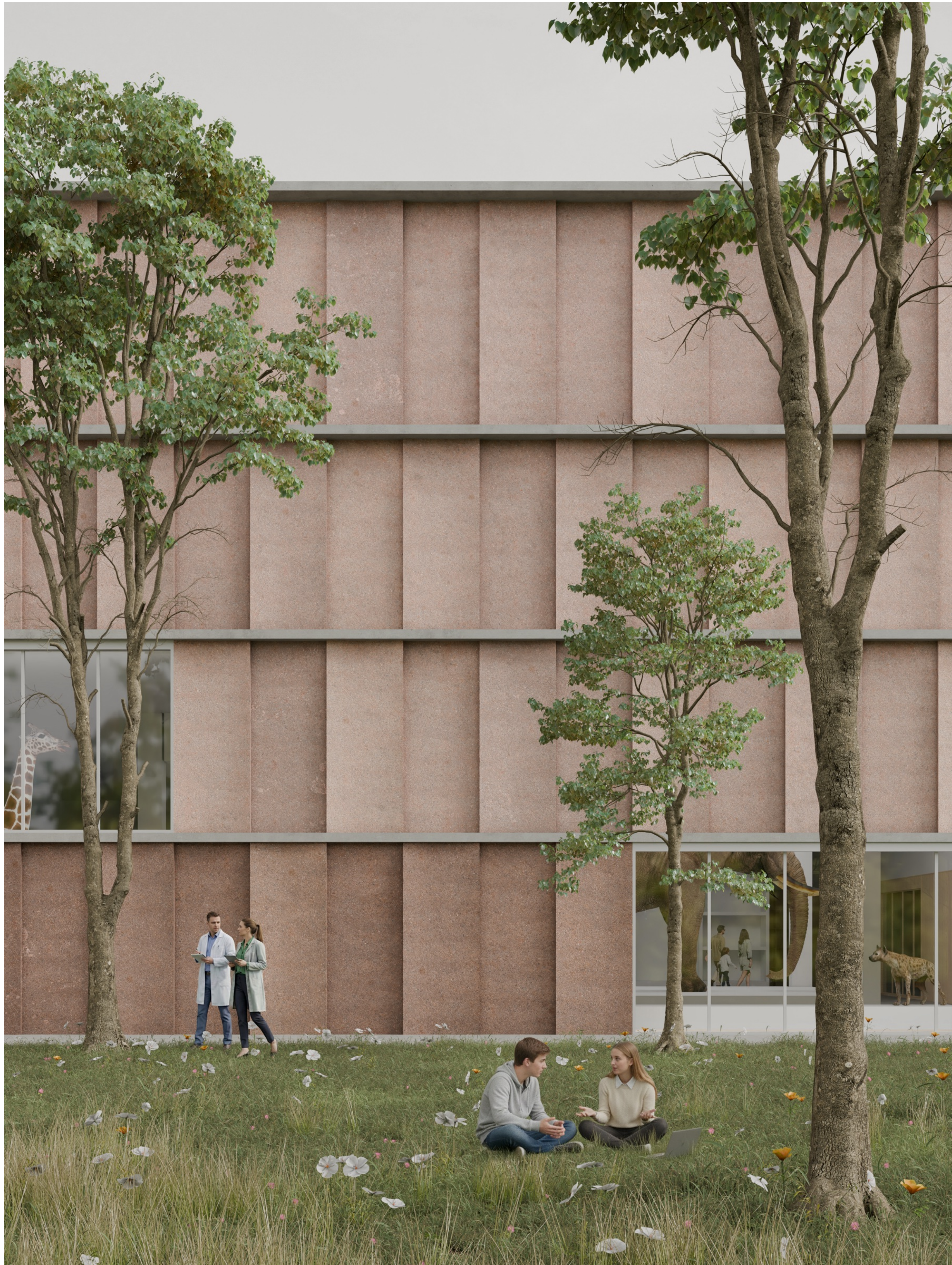
↑ Homlokzati részlet. A finombeton párkányok között íves alaprajzi kontúrú, agyagosföld adalékú csőműszőlbteton panelek adnak egyedi karaktert az épületnek.