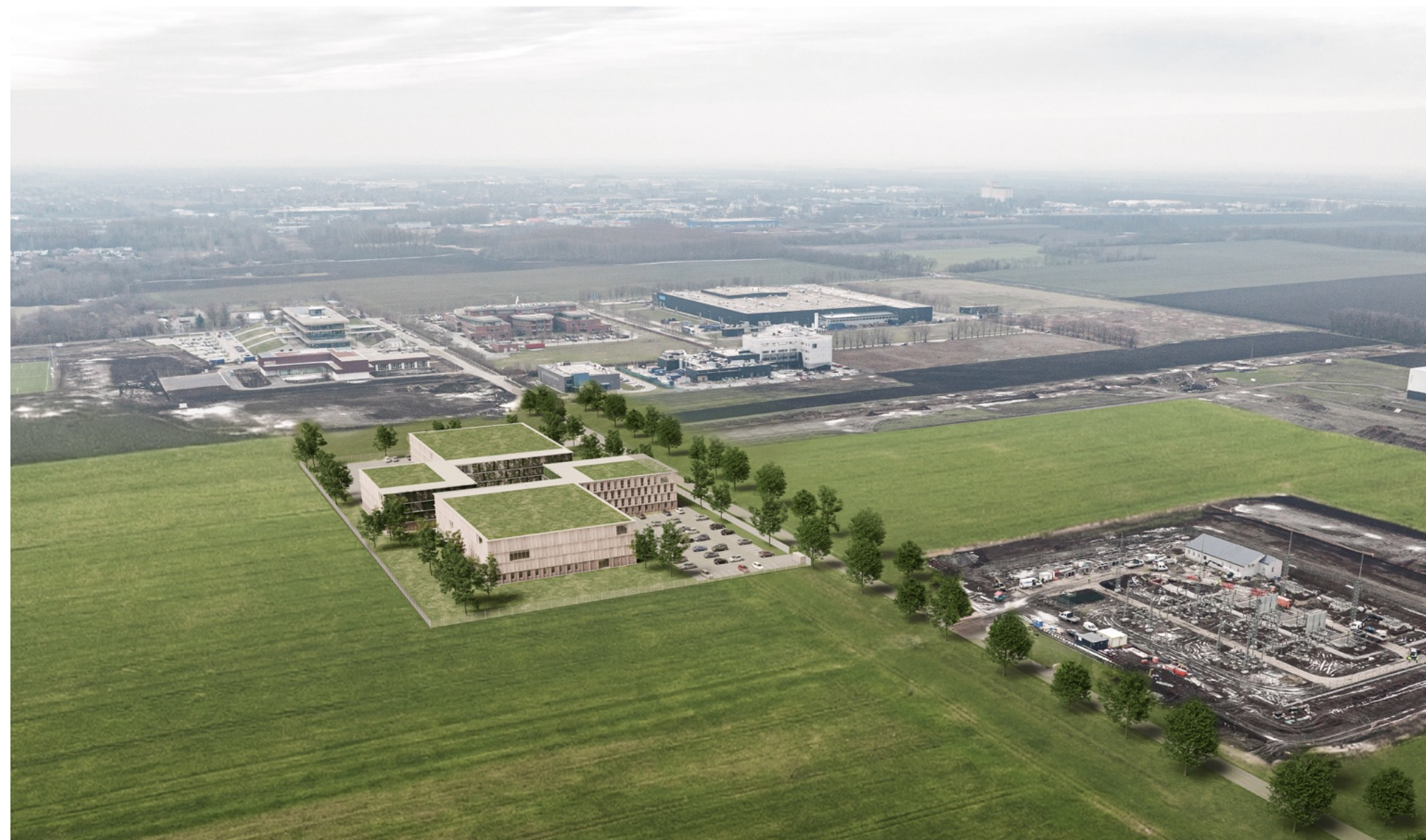
↑ Látványterv az épületről és a környezetéről északkelet felől