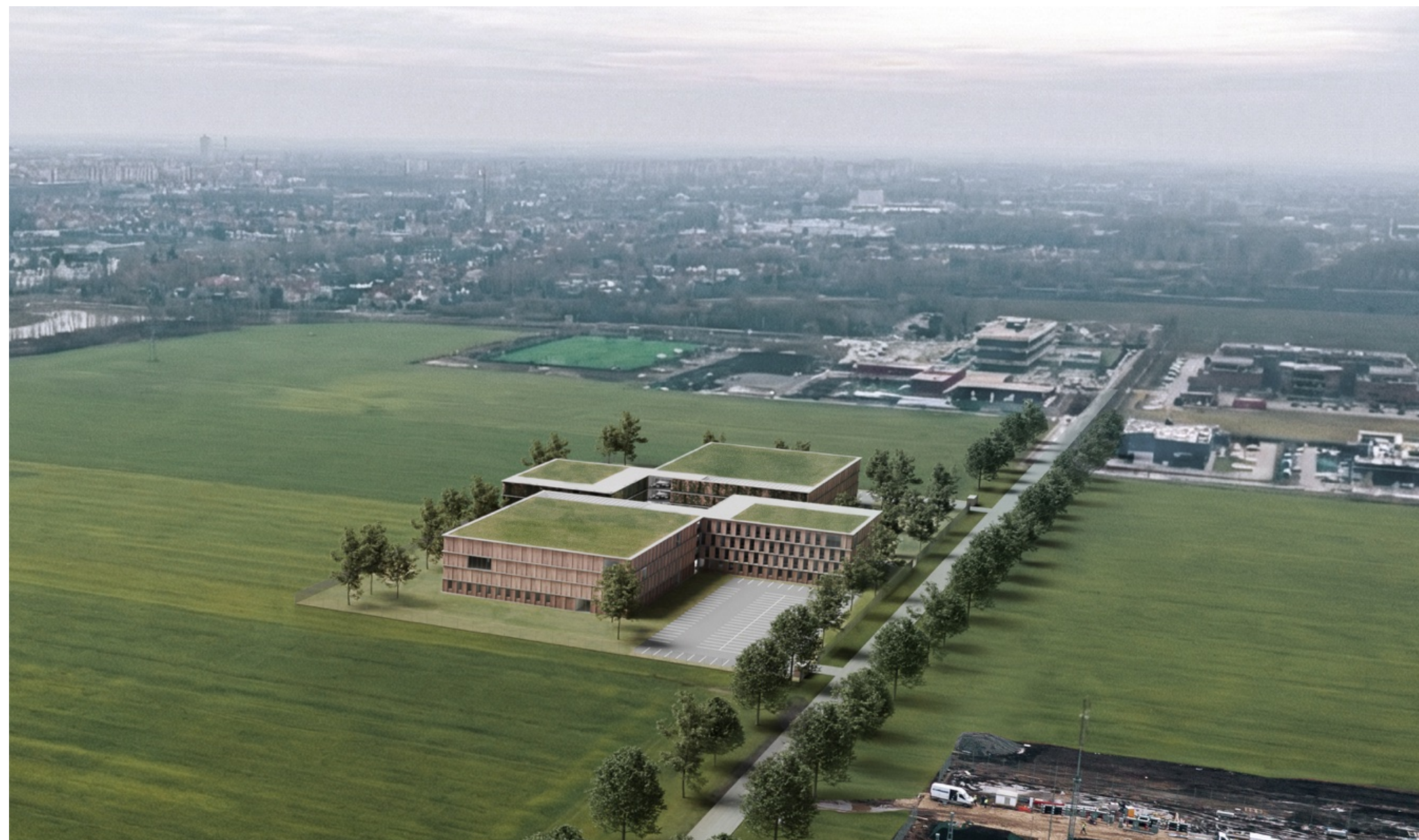
↑ Látványterv az épületről és a környezetéről északnyugat felől