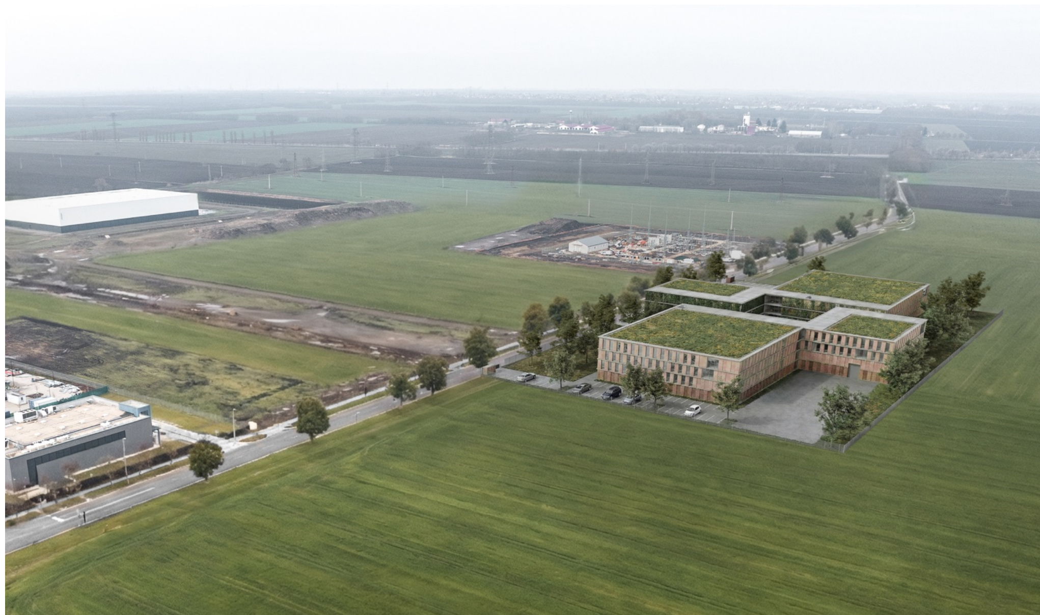
↑ Látványterv az épületről és a környezetéről délkelet felől