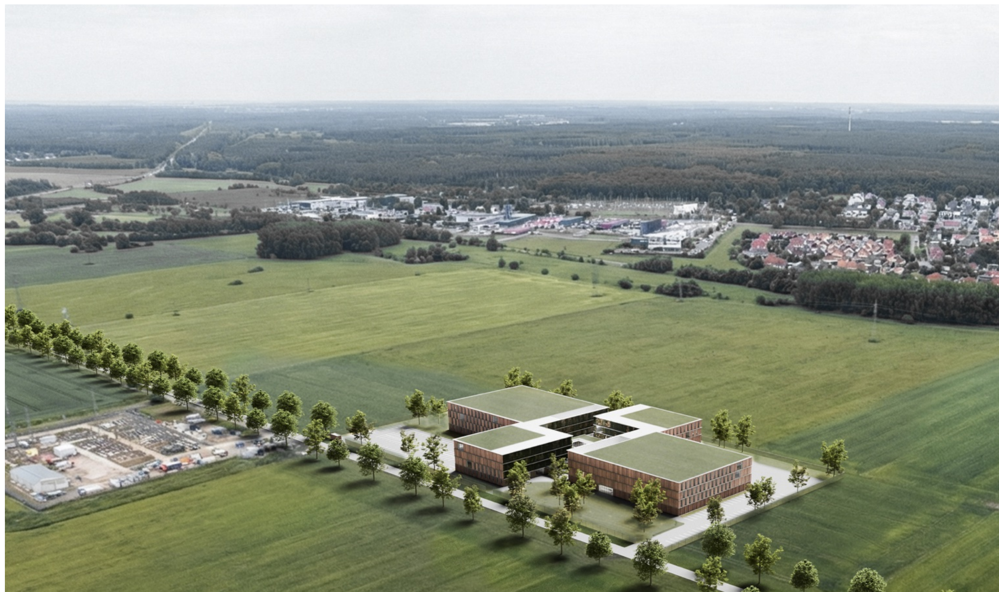
↑ Látványterv az épületről és a környezetéről délnyugat felől